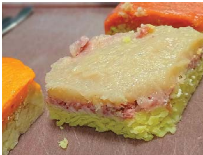
Moderní jídlo do ruky, takzvané krabkostky, snadno stravitelné i uchopitelné