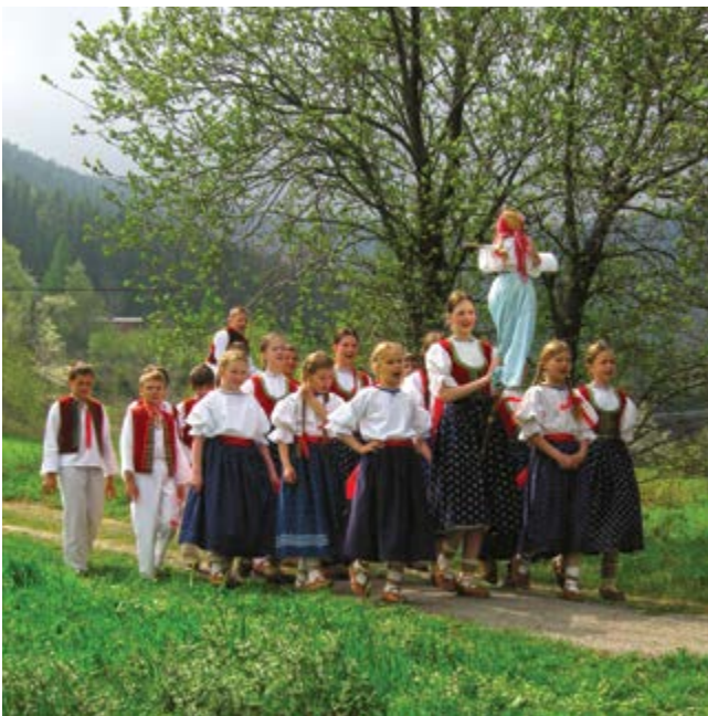
Valašský soubor Sedmikvítek, foto: Romana Stejskalová ▲▲▶