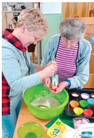
Jak uctít svatého Valentýna? Sladkými muffiny!