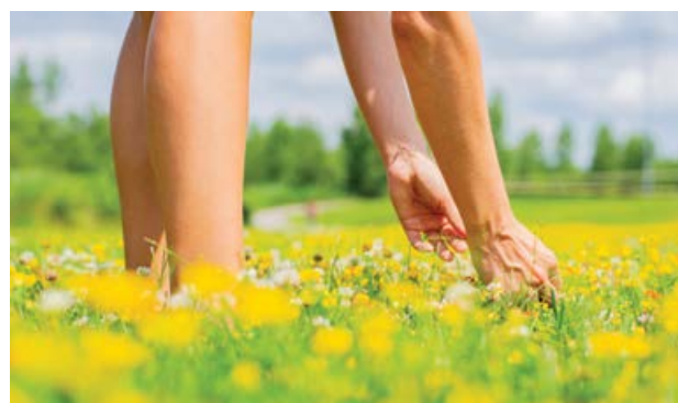
Sběr smetanky lékařské – pampelišky