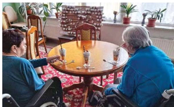
Pravidelná střeďeční kavárna