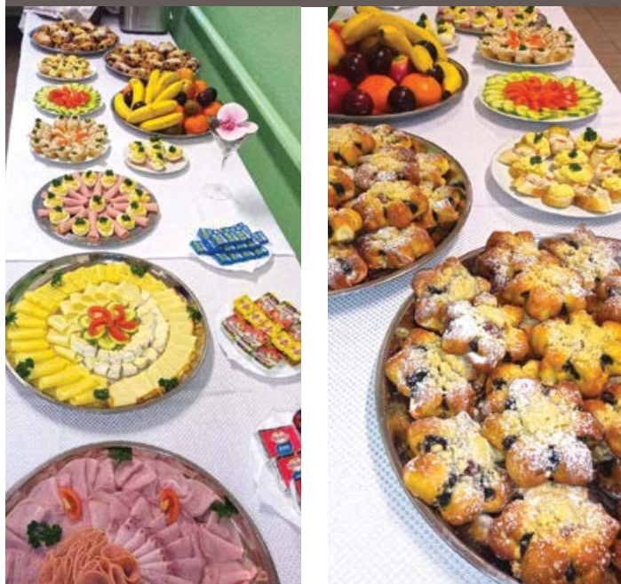
Rautové snídaně v Domově Hortenzie – jako v hotelu