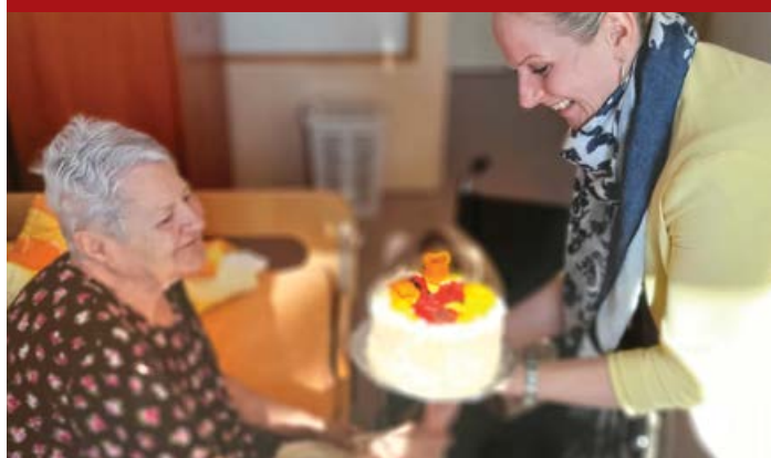
I v prvním čtvrtletí jsme slavili narozeniny a svátky