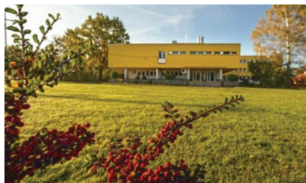
Jarní Domov Hortenzie