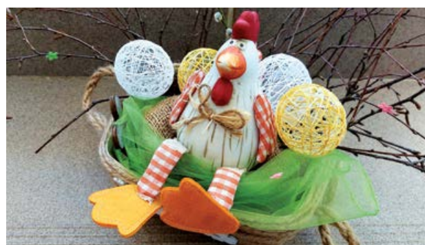
Velikonoční výzdoba v Domově Hortenzie