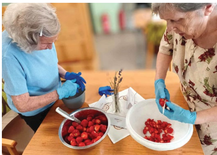
Kulinaření, příprava pohárů