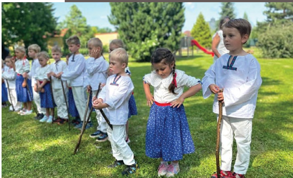
Valášek na Dni otevřených dveří DH

Letošní ročník jsme obohatili o mezigenerační setkání s dětmi z mateřské školy Montevláček Lichnov, které si pro nás v zahradě připravily nádherné vystoupení Valášku. V tomto souboru se zaměřují