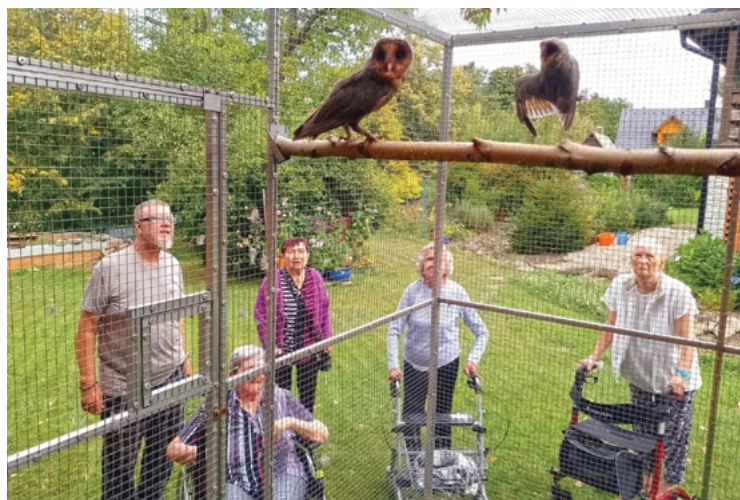
Letní aktivity – výlet za sovami do Trojanovic