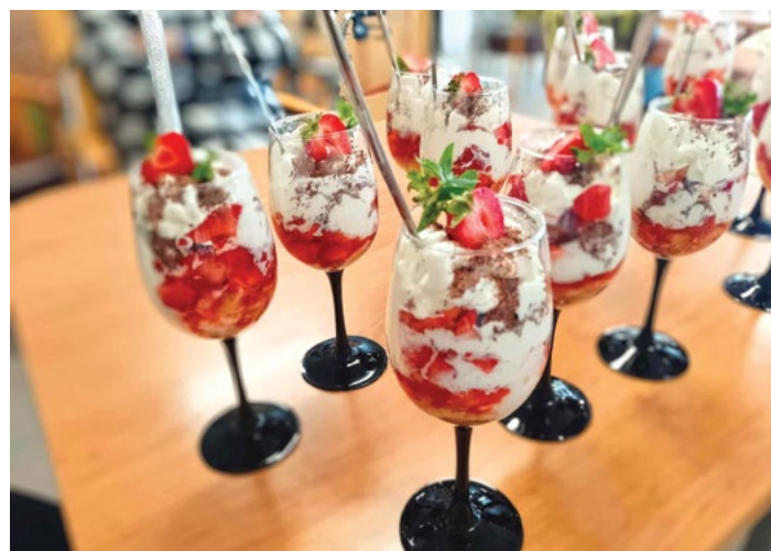
Kulinaření, jahodové poháry