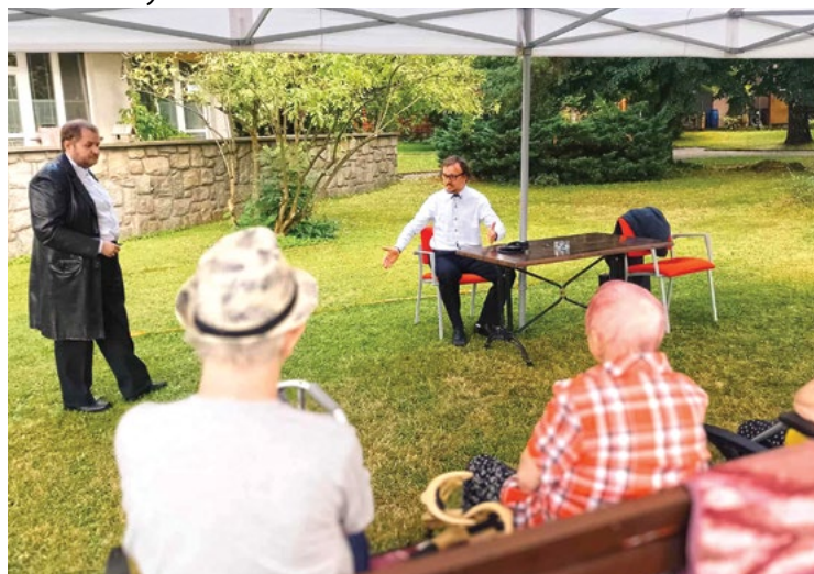
Letní aktivity – Nahé divadlo 19. 8. 2025